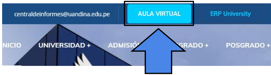
Figura 1. Acceso al Aula Virtual desde el Portal Institucional